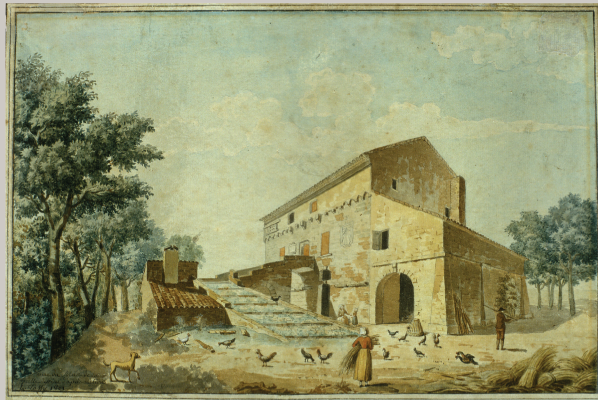
Aquarelle de la tour de Étienne Tassy 1801, propriété du Musée Arlaten