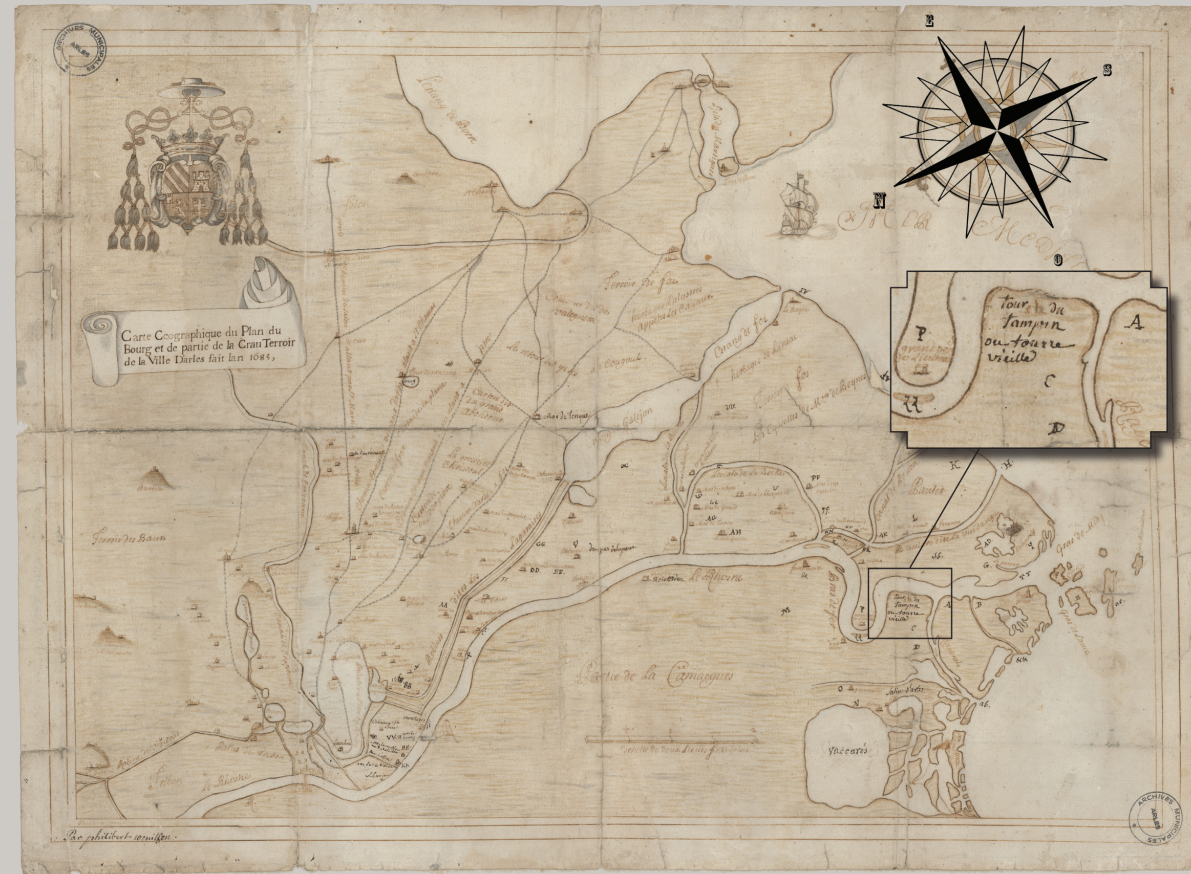
Carte du territoire de Camargue et Crau de 1683 avec localisation de la Tour du Tampan ou Tourvieille

Les décennies qui suivent verront la Tour perdre progressivement tout usage et toute fonction. Sa stature se délite progressivement jusqu'en 2008 où la dernière voûte s'effondre. À partir de 2009, le Conservatoire du littoral qui vient de se rendre acquéreur de la Tour et des 6500 hectares qui l'entourent, décide d'engager un programme de sauvegarde et de valorisation de cet édifice exceptionnel.