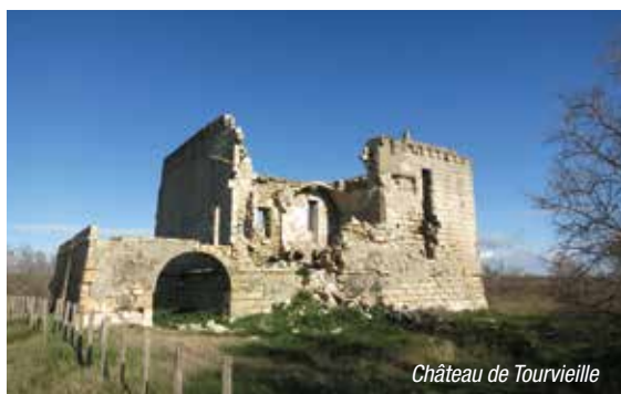
Château de Tourvieille

La restauration progressive du patrimoine s'inscrit dans une perspective d'accueil du public et d'attractivité touristique. Ainsi, le projet portant sur le château de Tourvieille, ancienne tour de défense du XVII e siècle inscrite aux Monuments historiques, vise à conforter le rôle de porte d'entrée sur le site. Ce bâtiment pourrait accueillir un belvédère offrant une vision panoramique sur les espaces camarguais.