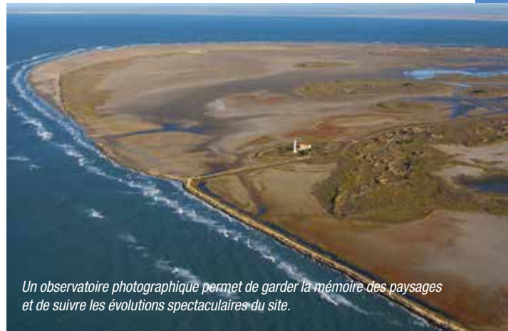
Un observatoire photographique permet de garder la mémoire des paysages et de suivre les évolutions spectaculaires du site.