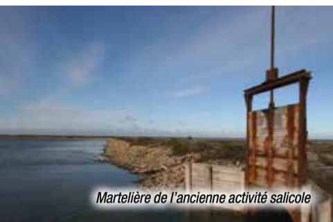
Martelière de l'ancienne activité salicole

La reconversion des anciens salins en site naturel favorise une recolonisation progressive des espaces par la flore ainsi que l'accueil d'importantes populations d'oiseaux.