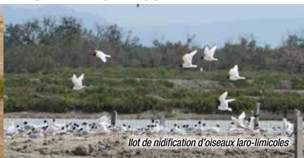
Ilot de nidification d'oiseaux laro-limicoles