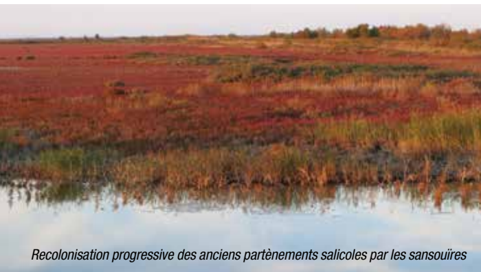
Recolonisation progressive des anciens partènements salicoles par les sansouïres