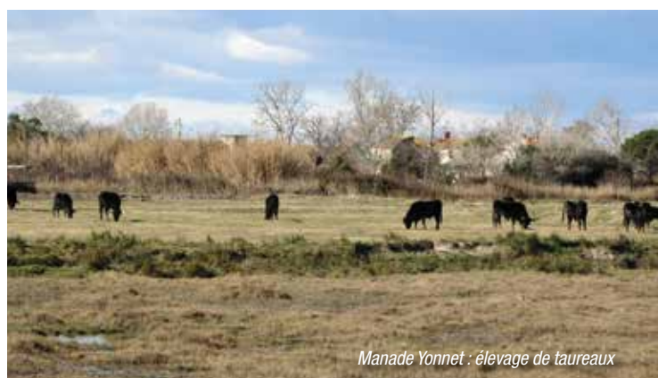
Manade Yonnet : élevage de taureaux