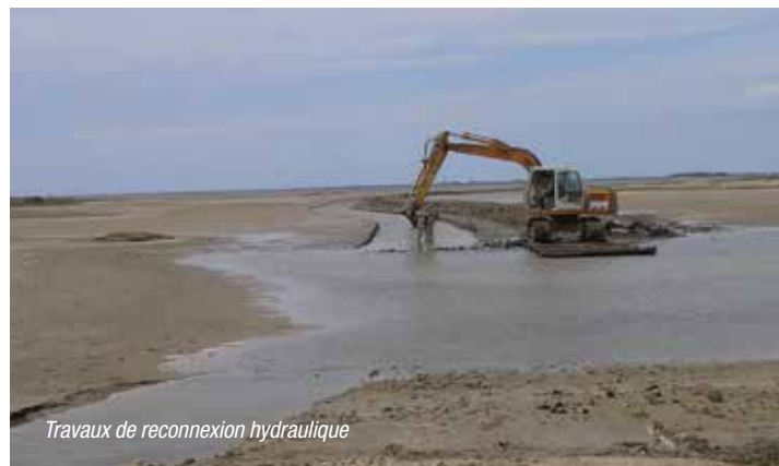
Travaux de reconnexion hydraulique

Elle implique aussi une réflexion concertée sur les usages et une sensibilisation du public à la problématique de la montée du niveau marin : la multiplication de brèches en front de mer après l'arrêt des travaux de renforcement des digues a en effet contribué à la renaturation du site.