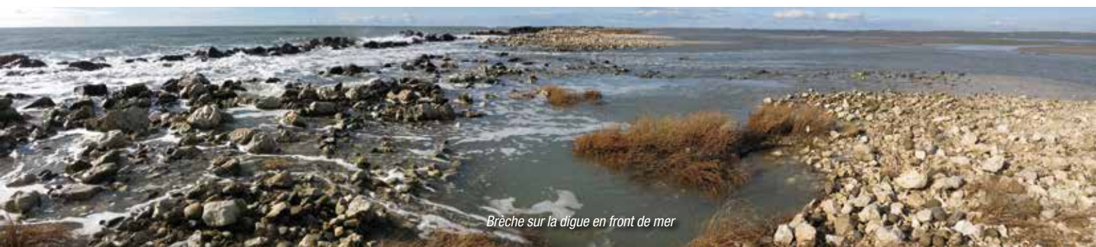
Brèche sur la digue en front de mer